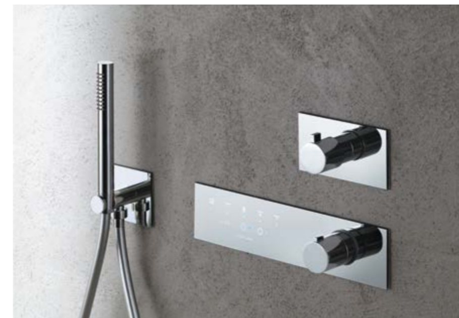
in this page KT035A (Glasspad) RU401A SD017A