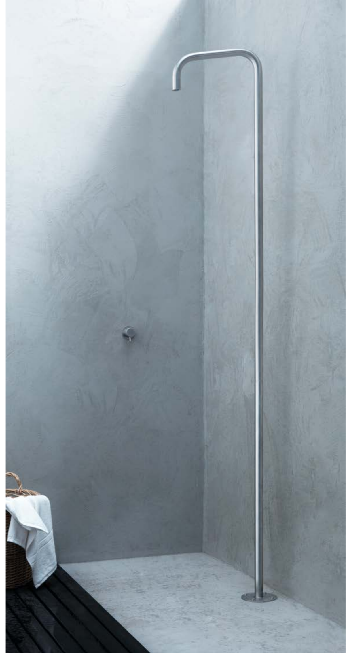
#Metal316 CL029E RU601E