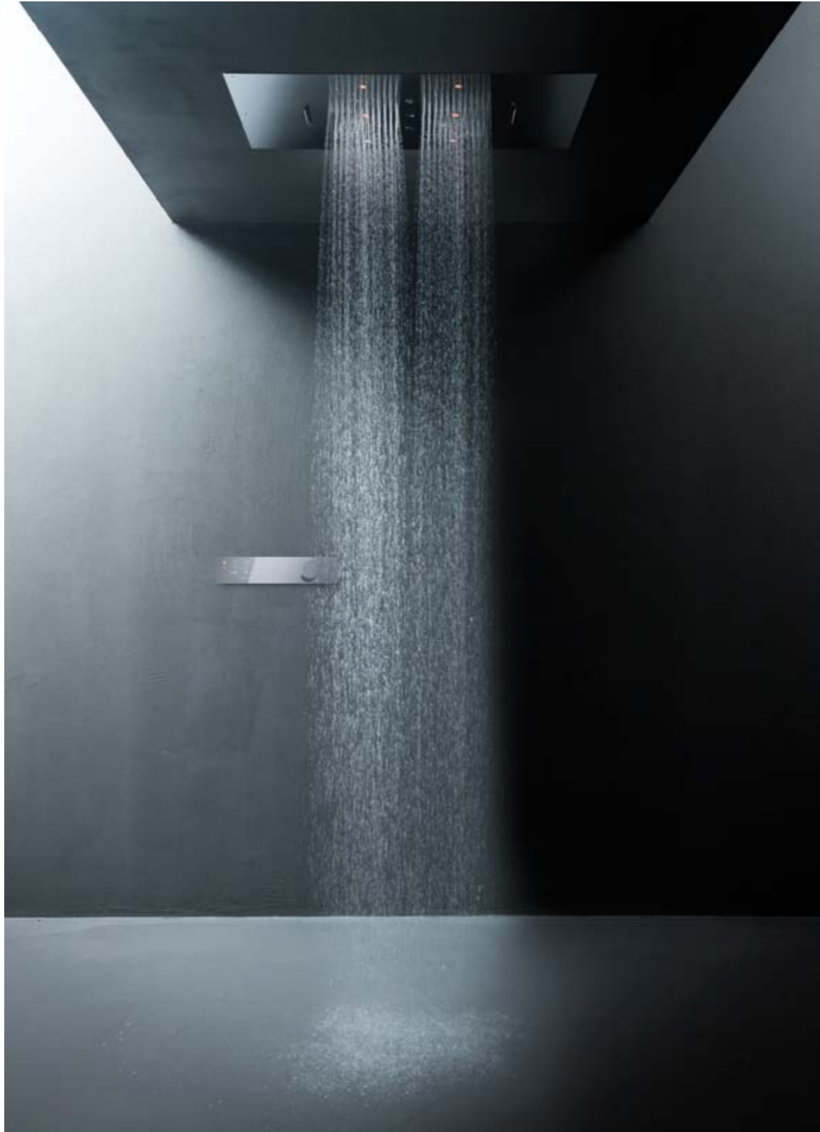
COLLECTION: SPA HOME