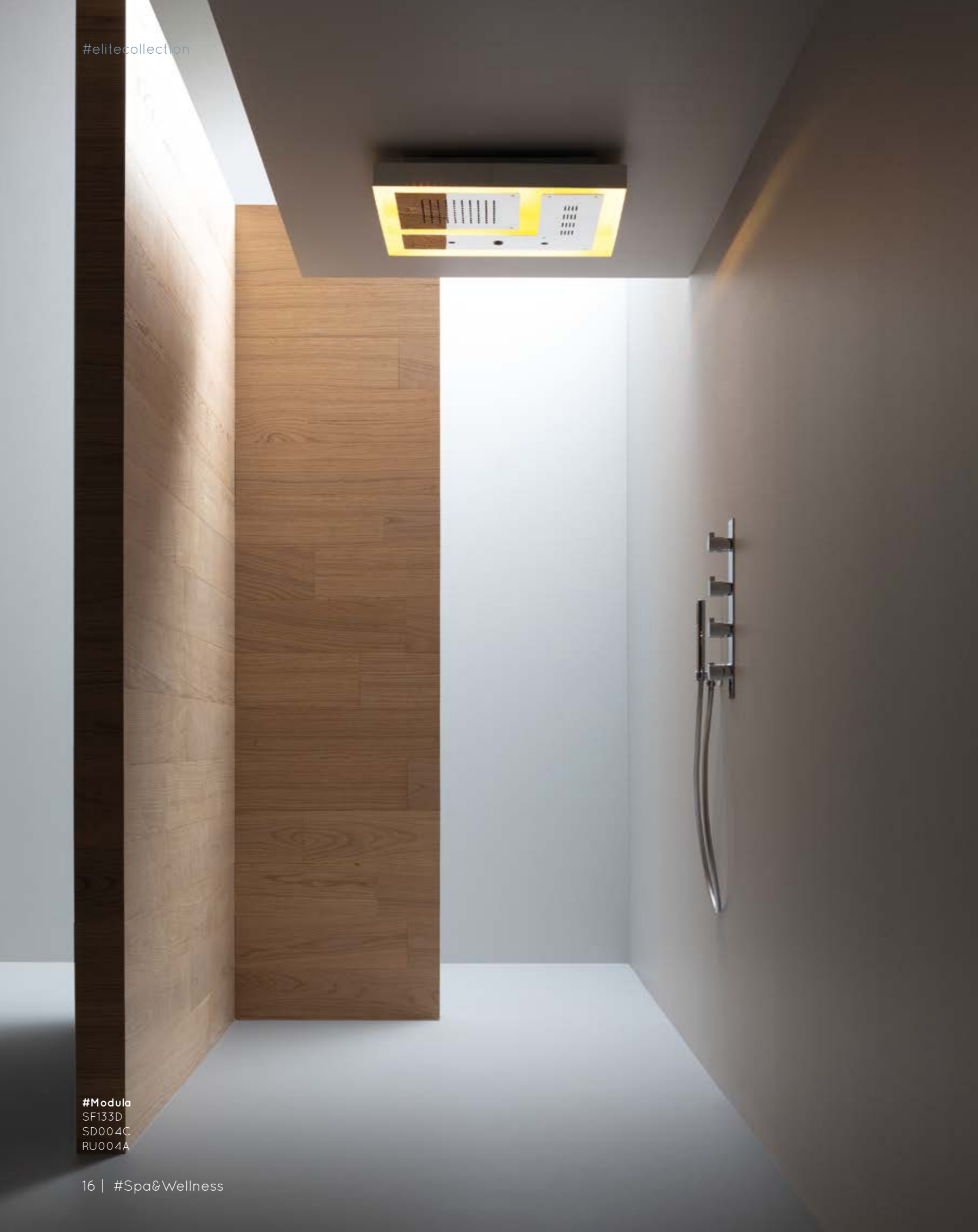
#Modula SF133D SD004C RU004A